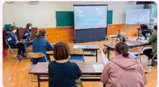
ケアマネジメント研修会の様子