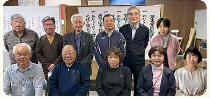
都於郡地区民児協