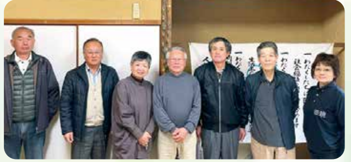
東米良地区民児協