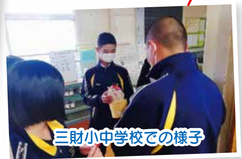
三財小中学校での様子